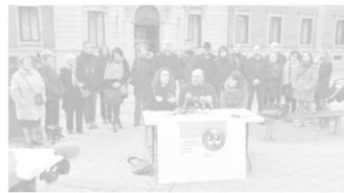
La Coordinadora denunció en diciembre la escasa partida al desarrollo.

Las jornadas se celebrarán en el Aula Magna de UNED Pamplona el viernes de 9.30 a 13.30 horas y de 16.30 a 20.30 horas, y el sábado de 9.30 a 14 horas. La inscripción, abierta hasta mañana, puede realizarse a través de www.unedpamplona.es/matricula .