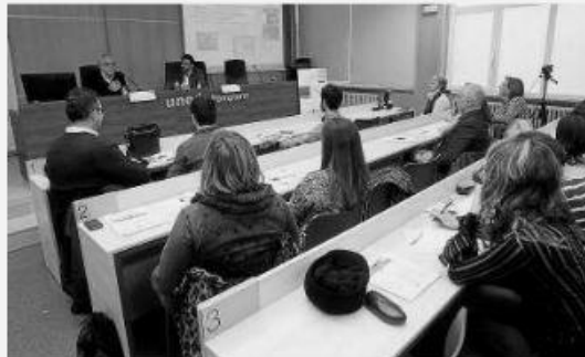
Las III Jornadas de Educación Social se celebraron el viernes y el sábado en las aulas de la UNED.