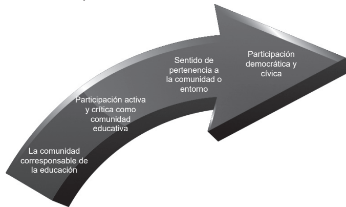
Figura 1: Cuando la comunidad es corresponsable de la educación se puede llegar a una participación democrática y cívica

En definitiva, lo social es el elemento integrador de la educación social y, además, es fundamental para su conformación como disciplina que se combina con la educación. En cualquier caso, sin el componente social no hay proceso educativo y sin lo educativo no hay relación social, que se plasma en las relaciones que establece el alumnado en el grupo de iguales, con la comunidad educativa, con la familia y con el entorno.